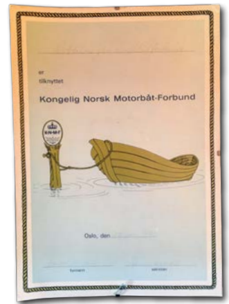
KOBBERNAGLEN BÅTFORENING har vært medlem av KNBF siden 1976.

båt plass» forplikter du deg til å jobbe 25 timer dugnad første året. Da blir medlemmet kjent med andre medlemmer og det bygges relasjoner.