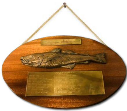
HVERT ENESTE ÅR arrangeres den årlige «Juletorsken» - en fiskekonkurranse med mye hyggelig samvær. I klubbhuset henger en plansje med alle vinnerne tilbake til 1988.