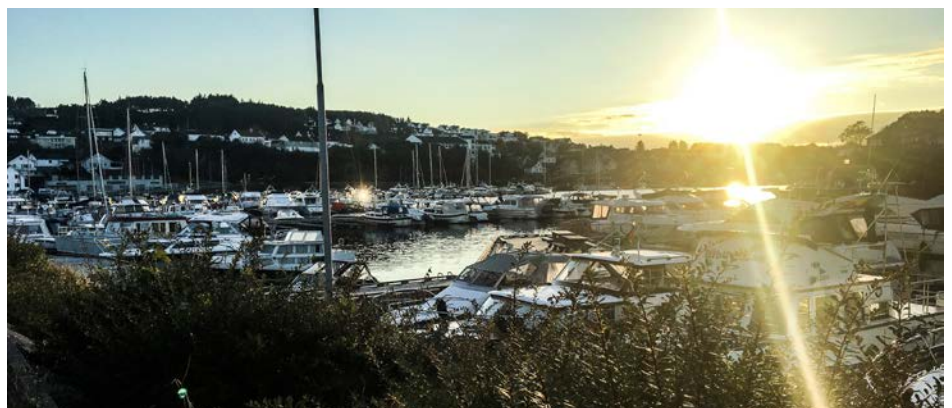
DEN IDYLLISKE FORENINGA ligger i Haugesund – på Karmøy – og her har de en 640 meter lang promenade langs hele havnebassenget, til fri bruk for alle.